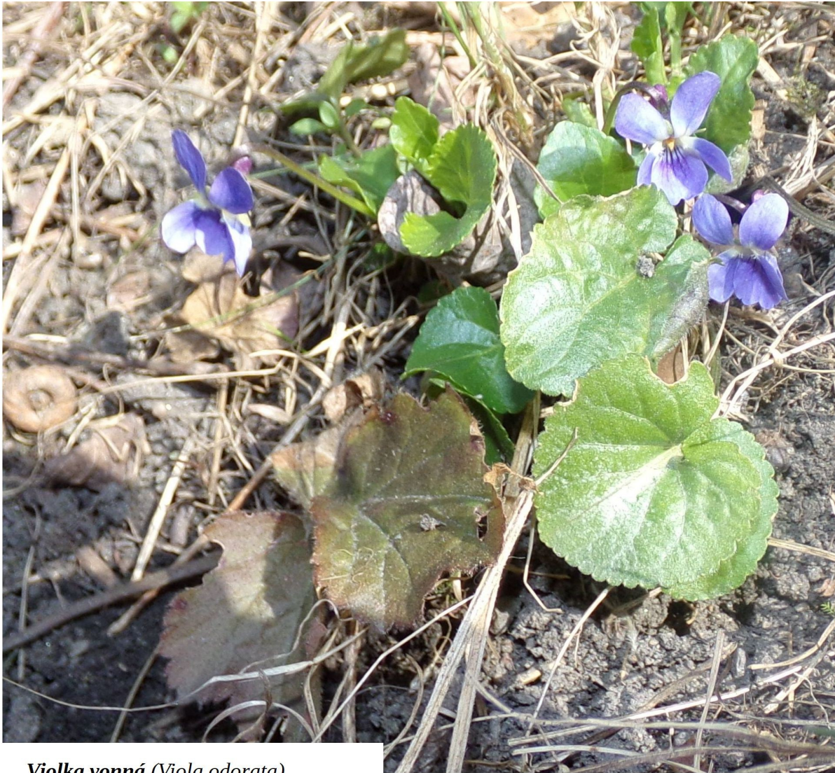
Violka vonná ( Viola odorata )