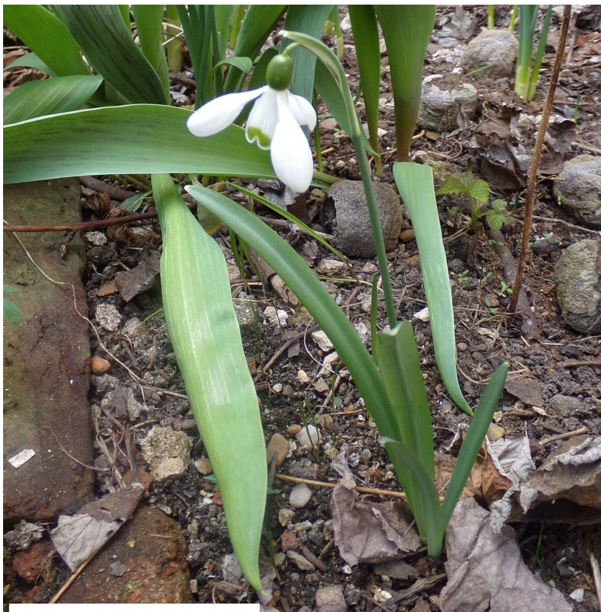
Sněženka podsnežník ( Galanthus nivalis )