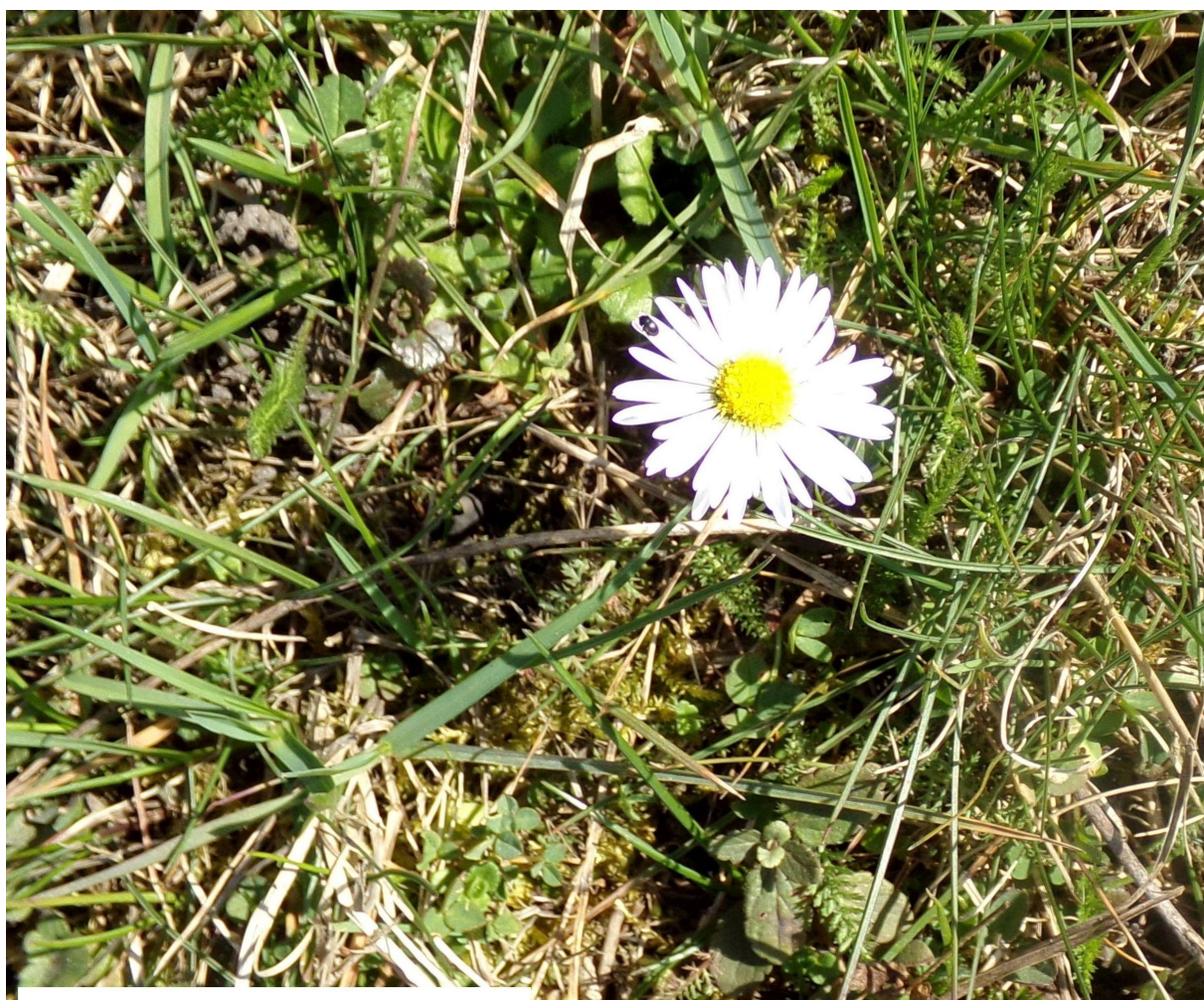
Sedmikráska chudobka ( Bellis perennis )